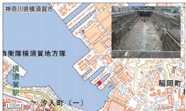
図6 横須賀海軍施設ドック(横須賀) 1号ドック●は明治4年に竣工。ドックは完成時の形のまま現在も使われている。