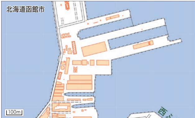
図1 函館どつく株式会社(函館) 東側対岸に青函連絡船「摩周丸」が係留されています。 http://www.hakodate-dock.co.jp/jp/ 1896(明治29)年創立の造船・橋梁・架設などを手がける企業。

形も大きさも異なりますが、ここで船を建造したり修理したりしているのですね。詳細は、各社工夫を凝らした内容で動画などもあり造船業を知るきっかけになると思います。(2023.9)