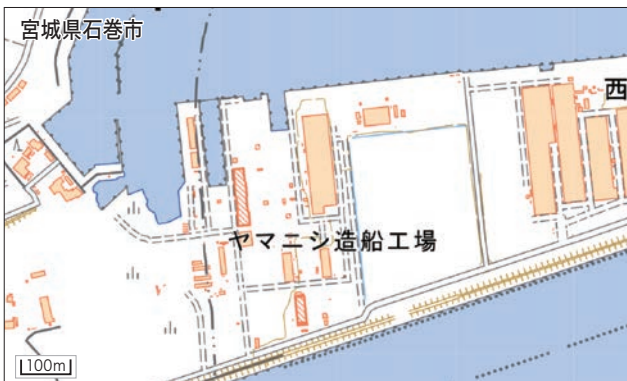
図2 ヤマニシ造船工場(広瀬・石巻・小野・渡波) https://www.yamanishi-miyagi.co.jp/ 1920(大正9)年創立の石巻市にある造船、船舶修理、鉄構造物製造を手がける企業。