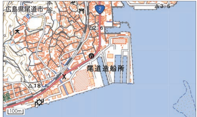
図4 尾道造船株式会社(尾道) https://onozo.co.jp/ja/ 1943(昭和18)年創立の造船、修理、各種構造物・機械の製作などを手がける企業。