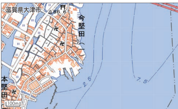
図3 株式会社 牟兵衛造船所(堅田) 北に琵琶湖大橋があります。 https://www.mokubezosen.jp/ 1872(明治5)年創立の琵琶湖に面する造船所。