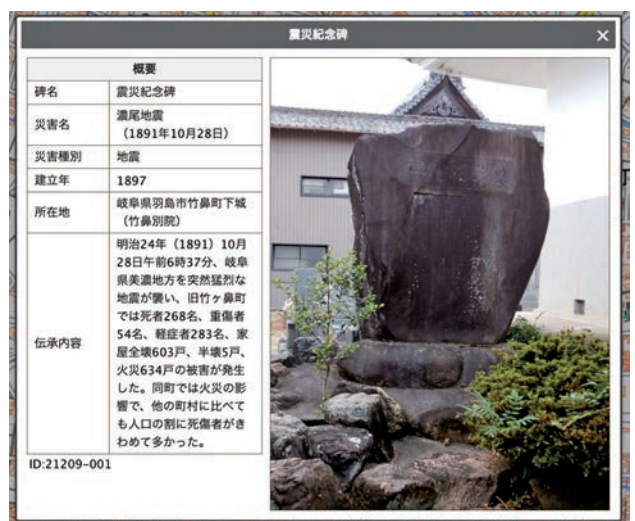
図2 自然災害伝承碑(同)

「活用ガイド」を一つずつ確認していくと、益々地理院地図の利用・応用が拡大し楽しさも増えていくでしょう。(2023.1)