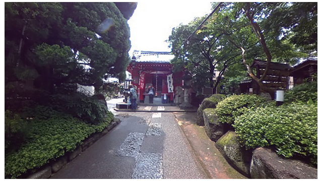
写真1 源覚寺 (こんにやくえんま)

地下鉄改札口・建物内の郵便ポスト・階段・エスカレーター・エレベーターの位置関係と事務室の位置が頭の中で明確には把握できていない。最寄りエレベーターから事務室まで60mあるという。エスカレーターは柱の陰、階によって利用できるエスカレーター・エレベーターが異なる、ドアにはカードキー等々、超近代的ビルは都会に疎いものにとっては迷路である。