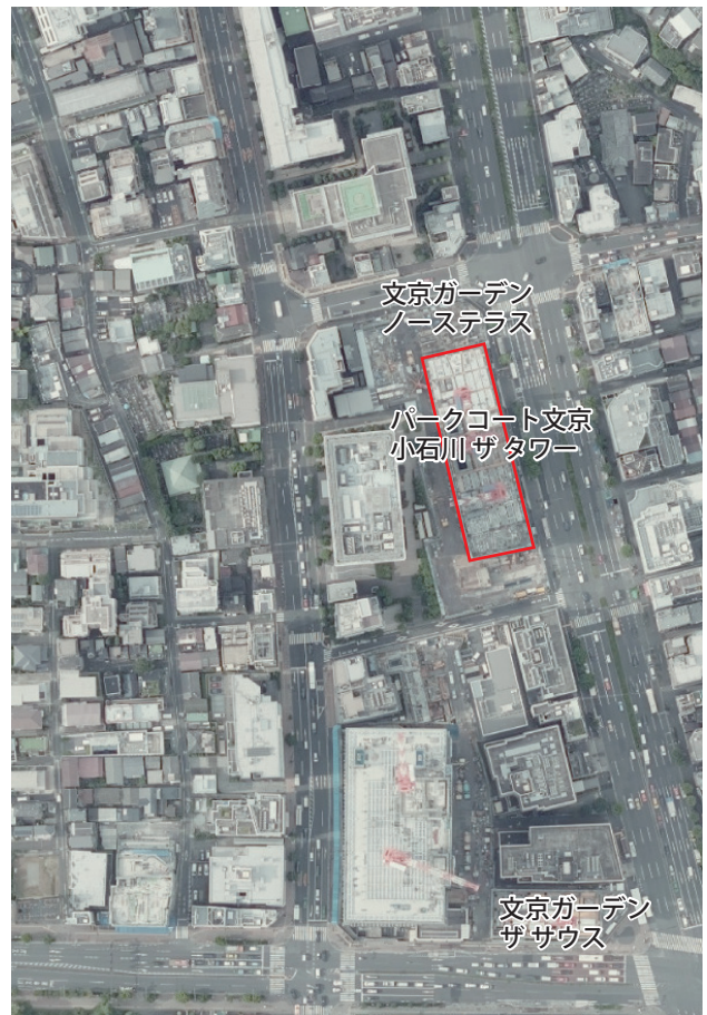
2021年3月に北街区のNX棟 (建物名称:パークコート文京小石川 ザタワー)とNY棟 (建物名称:文京ガーデン ノーステラス)が竣工。同年5月に南街区SB棟 (建物名称:文京ガーデン ザサウス)が竣工している。