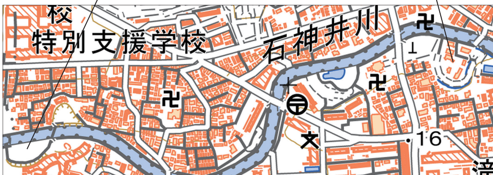
地理院地図(国土地理院)