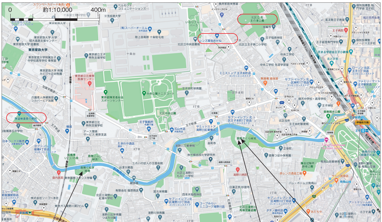
Google Map 京浜東北線王子駅-埼京線十条駅、石神井川境界