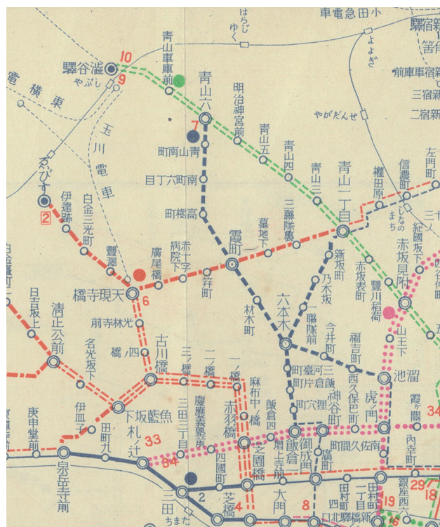
図2 『青山南町』出張所棟の位置 青丸 市電気局乗客課「電車運轉系統及停留所一覽圖」昭和7年11月現在 注:ただし当時は青山派出所期